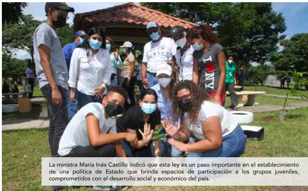
La ministra María Inés Castillo indicó que esta ley es un paso importante en el establecimiento de una política de Estado que brinda espacios de participación a los grupos juveniles, comprometidos con el desarrollo social y económico del país.

Todos estos esfuerzos permiten consolidar un proceso más legítimo y cada vez más consolidado a nivel jurídico, lo que fundamenta y refuerza las bases de la institucionalidad de juventud del país.