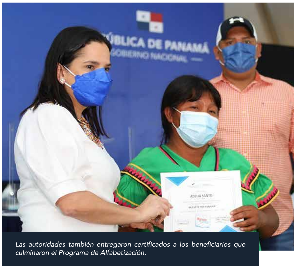
Las autoridades también entregaron certificados a los beneficiarios que culminaron el Programa de Alfabetización.

La titular de la cartera social explicó que las giras comunitarias le permiten al Gobierno Nacional atender las principales necesidades que tienen las comunidades, además, es una oportunidad para trasladar toda la oferta del Estado a los corregimientos con altos índices de pobreza.