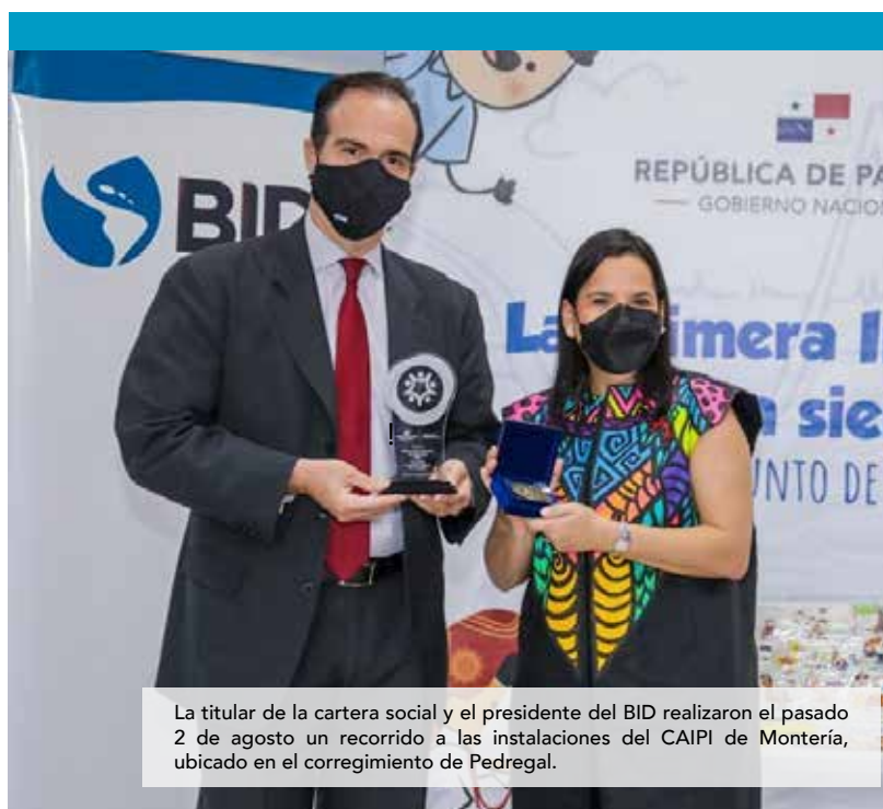
La titular de la cartera social y el presidente del BID realizaron el pasado 2 de agosto un recorrido a las instalaciones del CAIPI de Montería, ubicado en el corregimiento de Pedregal.

En coordinación con el BID y otras instituciones, el MIDES ha reabierto de forma exitosa 125 CAIPI con una población atendida de 2,000 niños(as) y 900 maestros.